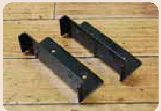
[棚受け金具] (棚板の枚数) ×1セット