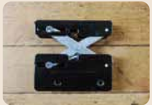
[突っ張りジャッキ] (2個)