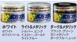
ホワイト ホワイトパール ライト&メタリック シルバー、ピンク イエロー、ゴールド ライトブルー ターク&メタリック ブラック、グリーン ガンメタリック タークブルー、レッド

車の色によって汚れの目立ち方や艶の出し方が違うため、【ワックス】もボディカラーやコーティングによって種類が異なります。必ずあなたのお車に合ったものをお選びください。