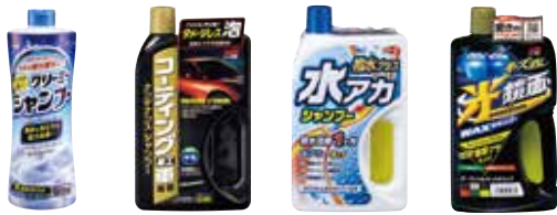
【カーシャンプー各種】