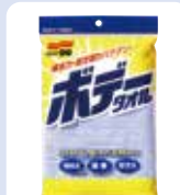
【拭き取り用タオル】