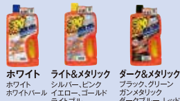
ホワイト ホワイトパール ライト&メタリック シルバー、ピンク イエロー、ゴールド ライトブルー ターク&メタリック ブラック、グリーン ガンメタリック タークブルー、レッド

【カーシャンプー】は白色系や濃色系などの車体の色や、コーティングの有無などによってさまざまな種類がありますので、あなたの車に合ったものを選びましょう。