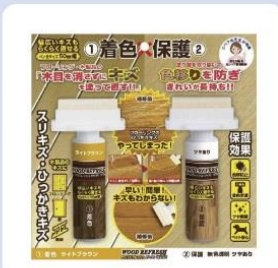
[ウッドリフレッシュシリーズ]