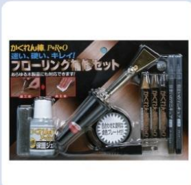
[かくれん棒シリーズ]