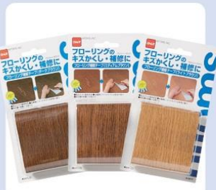
[フローリングキズ補修テープ]