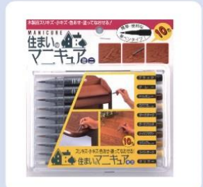
[住まいのマニキュア]

[フローリングの補修道具セット] [拭き取り用布] [電熱補修コテ] [耐熱保護ジェル] など