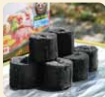
[ 着火炭 ]