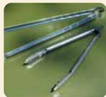
[ トング ]