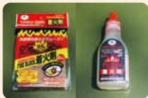
[ 着火剤 ]

[ バーベキューグリル ] グリルには、スタンド型や卓上型などの種類があります。用途に合わせて選びましょう。