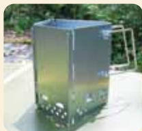
[ 火おこし器 ]

[ バーベキューグリル ] グリルには、スタンド型や卓上型などの種類があります。用途に合わせて選びましょう。