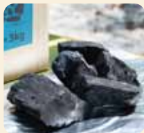
[ 木炭 ]