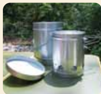
[ 火消し壺 ]