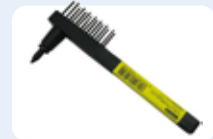
【チッピングハンマー】