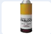
【スパッタ付着防止剤】