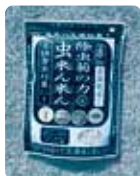
[虫来ん来ん] (防虫剤)