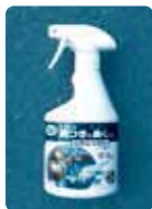
[トマトトーン スプレー] (植物成長調整剤)