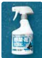
[ベニカマイルド スプレー] (殺虫・殺菌剤)