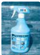
[モスピラン・ トップジンMスプレー] (殺虫・殺菌剤)