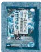
[すずなり] (有機質肥料)