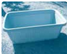
[ベジタブルプランター700型]