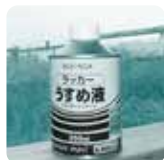
[ラッカーうすめ液]