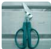
[牛乳パック用ハサミ]