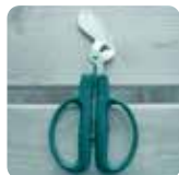
[ペットボトル用ハサミ]